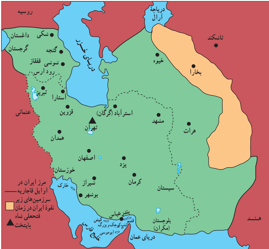
قلمرو ایران (در اوایل قاجاریه)

هجوم سیاسی-نظامی دولت های استعمارگر اروپایی، زمینه ساز بیداری اسلامی در ایران شد. عالمان دین برای مبارزه با نفوذ بیگانگان و مخالفت با سلطه استعماری از قواعد قرآنی و اسلامی مانند «قاعده نفی سبیل»، «جهاد» و «فتوا» بهره بردند. عالمانی همچون آیت الله شیخ جعفر نجفی کاشف الغطاء و آیت الله سید محمد مجاهد، که مقیم عتبات عالیات بودند، و ملا احمد نراقی و برخی از علمای ایران علیه روس ها فتوای جهاد دادند، و بعضی از آنها خود نیز در جبهه های جنگ شرکت کردند. این امر موجب شد که مردم ایران و حتی شهرهای نجف و کربلا، مشتاقانه در مناطق اشغالی به مقابله با روس ها پردازند و جلوی پیشروی آنان را بگیرند.