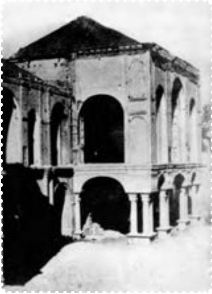
ساختمان مجلس شورای ملی پس از به توپ بستن توسط لیاخوف در ایام مشروطیت

ملک‌المتکلمین و سید جمال‌الدین واعظ اعدام شدند. بعضی از نمایندگان نیز که مورد تعقیب قرار گرفته بودند (از جمله تقی زاده)، به سفارت انگلیس پناه بردند. ۱ بدین گونه، دوباره، برای مدتی، استبداد حاکم شد. این دوره که یک سال به طول انجامید بار دیگر استبداد به جای مشروطیت حاکم شد. از این رو آن را دوره استبداد صغیر نامیده‌اند.