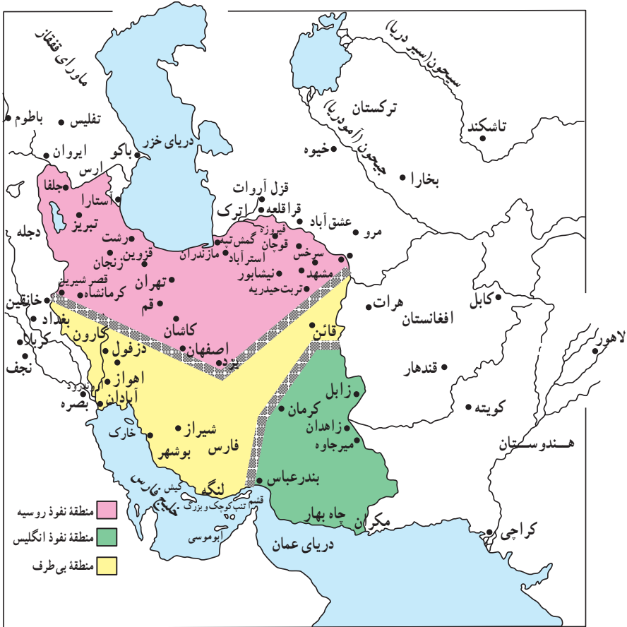
نقشه تقسیم ایران براساس قرارداد ۱۹۰۷

افغانستان که دارای ارزش حیاتی برای دفاع از هند بود، قلمرو نفوذ انگلستان مقرر گردید. قسمت سوم که شامل کویرها و بیابان‌های بی‌آب و علف بود، منطقه بی‌طرف و متعلق به ایران شناخته شد. منظور از این کار هم آن بود که دو دولت تا حدودی از یکدیگر فاصله بگیرند و از برخوردهای احتمالی بین آنها، جلوگیری شود.