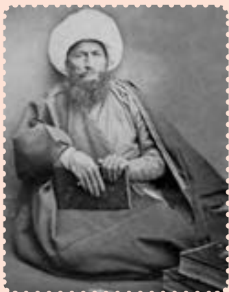
آیت الله حاج ملاعلی کنی

آیت الله ملاعلی کنی ملقب به رئیس المجتهدین (۱۱۸۴ - ۱۲۶۷ ش.) از علمای معروف و مبارز ایران در قرن سیزدهم و اوایل قرن چهاردهم