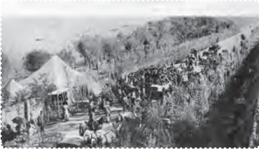
بازگشت علما از مهاجرت کبری

مظفرالدین شاه تسلیم خواسته‌های مردم شد. او عین‌الدوله را عزل کرد و فرمان تشکیل مجلس شورای ملی را در ۱۴ مرداد ۱۲۸۵ صادر کرد. هفت روز بعد، علما، با استقبال پرشکوه مردم، از قم بازگشتند. شهر چراغانی و جشن شادی به پا شد و در ۲۸ مرداد، اولین دوره مجلس شورای ملی با حضور نمایندگان تهران تشکیل گردید. عده‌ای از سیاستمداران مشروطه‌خواه، به تدوین قانون اساسی پرداختند ۱ . آنان با عجله آن را نوشتند و به امضای مظفرالدین شاه رساندند. شاه، ده روز پس از امضای قانون اساسی، درگذشت. به این ترتیب، کشور استبداد زده‌ی ما، با بهره‌گیری از اندیشه‌های سیاسی عالمان بزرگ دینی، کوشش فرهیختگان جامعه و مجاهدت مردم، به حکومتی دست یافت که می‌بایست براساس قانون اداره می‌شد.