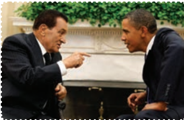
مبارک دیکتاتور مخلوع مصر و اوباما رئیس‌جمهور آمریکا

در سال ۱۲۶۰ش/۱۸۸۱م انگلیسی‌ها، مصر را اشغال کردند. تحت تأثیر تحولات ناشی از جنگ جهانی اول، کوشش مصری‌ها برای رهایی از سلطه استعماری انگلستان بیشتر شد و سرانجام انگلیس به وضعیت تحت‌الحمایگی این کشور پایان داد و در این کشور نظام سلطنتی مشروطه اعلام کرد.