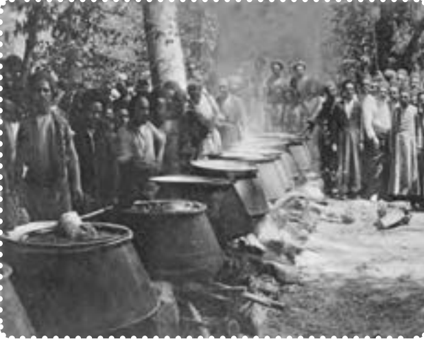
دیگ‌های غذا در سفارت انگلیس برای مشروطه خواهان

بدون پناهندگی به سفارت انگلستان، می‌توانستند به خواسته‌های خود دست یابند. دولت انگلستان بر خلاف دولت روسیه که از دربار حمایت می‌کرد، به ظاهر پشتیبان نهضت مشروطه بود. انگلستان، برای نیل به مقاصد و منافع استعماری‌اش این سیاست را در پیش گرفته بود. اما کسانی که از سیاست پیچیده استعمار انگلستان درک روشنی نداشتند