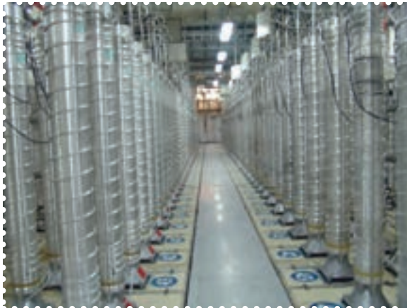
تأسیسات هسته ای نظنز

دستیابی به فناوری هسته ای صلح آمیز، یکی از عظیم ترین و افتخار آمیزترین دستاوردهای فنی و علمی انقلاب اسلامی است. دسترسی به چرخه سوخت هسته ای، یعنی فرایند تبدیل اورانیوم طبیعی به