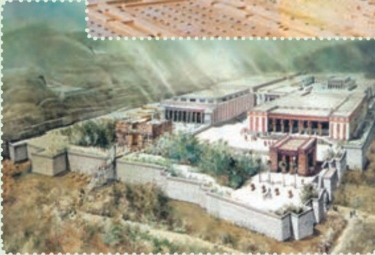
تخت جمشید و طرح خیالی آن

یافته است. ۱ برخی معتقدند، «ذوالقرنین» که در قرآن مجید ۲ به عنوان فرمانروایی نیک سیرت ستوده شده، همان کوروش پادشاه ایران است. ۳ با اینکه مؤسس دولت مقتدر هخامنشیان از سرزمین پارس