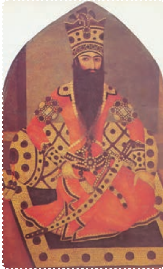
فتحعلی شاه، دومین پادشاه قاجاریه

ایران و روس شد. این جنگ‌ها از سال ۱۱۸۲ تا ۱۱۹۱ ش به درازا کشید، و به بسته شدن «عهدنامه گلستان» ۱ انجامید. به موجب این عهدنامه، ایران حاکمیت روسیه را بر ولایت‌هایی که تا آن زمان اشغال کرده بود به رسمیت شناخت. به این ترتیب ایالات داغستان و گرجستان و شهرهای باکو، دربند، شیروان، قره‌باغ، شکئی، گنجه، موقان و قسمت بالای طالش، به روسیه واگذار شد. به علاوه، حق کشتی‌رانی در دریای خزر، از ایران سلب گردید، در برابر، روسیه نیابت سلطنت عباس میرزا را در ایران به رسمیت شناخت و رساندن او به سلطنت را تعهد کرد. این بند که ظاهراً امتیازی برای ایران به حساب می‌آمد، در واقع به منزله نادیده گرفتن استقلال کشور و به رسمیت شناختن دخالت روسیه در امور داخلی آن بود.