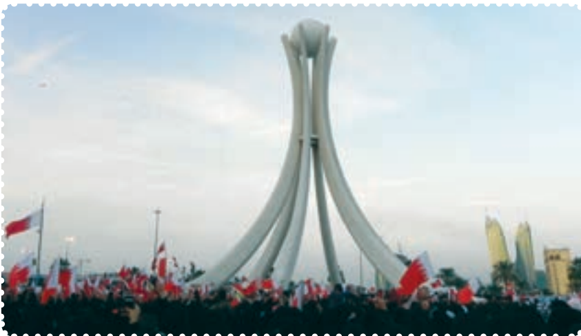
میدان لولو، نقطه آغازین قیام بحرینیان

سابقه جنبش‌ها و فعالیت‌های سیاسی در بحرین به سال‌های قبل از پیروزی انقلاب اسلامی، خصوصاً به اوایل دهه ۱۹۶۰ بر می‌گردد. ۲ اما بروز انقلاب اسلامی در ایران را باید منشأ تحولات و دگرگونی‌های جدید سیاسی در بحرین به حساب آورد. مردم بحرین به‌طور جدی خواستار انجام اصلاحات اساسی و برکناری حکومت آل خلیفه هستند و در این راه شهدای زیادی را تقدیم کرده‌اند ولی به دلیل حمایت خارجی از آن رژیم و سرکوب شدید مردم، انقلاب بحرین هنوز به نتیجه نرسیده است.