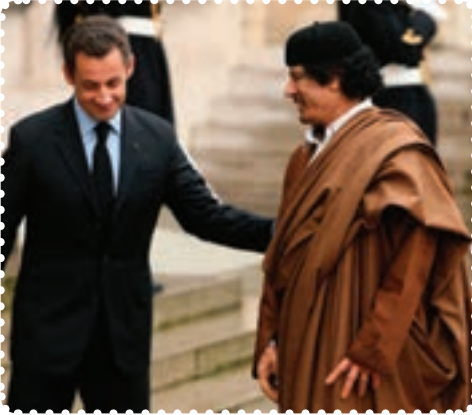
قذافی و سارکوزی رئیس جمهور پیشین فرانسه