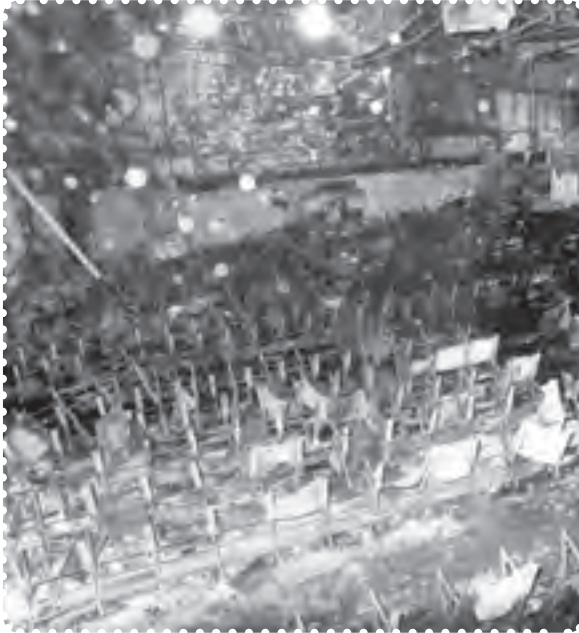
سینما رکس آبادان

امام خمینی، به شدت مورد حمله و توهین قرار گرفته بود. ۱