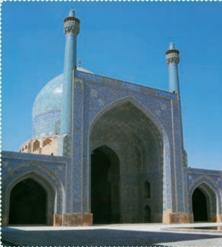
مسجد امام از آثار دوره صفوی در اصفهان

صفویان حکومتی تشکیل دادند که بیش از دو سده دوام یافت. در پرتو این حکومت مقتدر، علاوه بر برقراری امنیت و رونق اقتصادی، پیشرفت بازرگانی و کشاورزی و صنعت، تشکیل ارتش منظم و سیاست خارجی مقتدرانه، آنها توانستند فرهنگ و تمدن ایران و اسلام را بار دیگر شکوفا کنند. هنر و معماری در این دوره نیز از نظر کمی و کیفی توسعه و تحول یافت. اصفهان، پایتخت صفویان، دارای مجموعه‌ای از معماری عصر صفوی است که نشان می‌دهد، معماری ایرانی