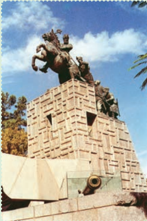
مجسمه و آرامگاه نادرشاه افشار در مشهد مقدس

توانست با شیوه حکومت داری توأم با ملاحظت، عدالت و رفاه نسبی، نام نیکی از خود بر جای بگذارد. ۱ وی تلاش کرد روابط خارجی ایران را که به دلیل هرج و مرج و نبود امنیت دچار اختلال شده بود، سامان بخشد، همچنین در برابر گسترش فعالیت های بازرگانی انگلستان در ایران ایستادگی کرد ۲ و از منافع نامشروع و استعماری این دولت جلوگیری به عمل آورد.