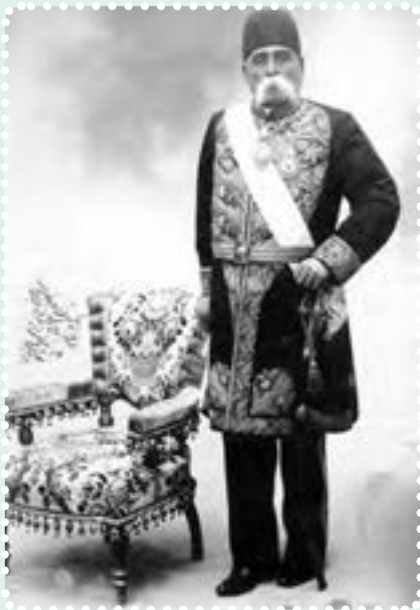
عبدالمجید میرزای عین الدوله

به هم ریخت؛ بازارها بسته شد و مردم در «مسجد شاه» گرد آمدند. در پی این تجمع، مردم نیرو گرفتند و کشمکش بین طرفداران استبداد و عدالت خواهان، شدت گرفت. دولت به وحشت افتاد و با پادرمیانی حاج میرزا ابوالقاسم امام جمعه، به طور موقت، قضیه فیصله یافت. حاج میرزا ابوالقاسم، داماد مظفرالدین شاه بود. او از جانب شاه به امامت جمعه تهران منصوب شده بود و از وی و دربار، پشتیبانی می کرد.