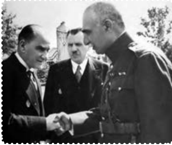
رضا شاه هنگام ملاقات با آتاتورک در ترکیه