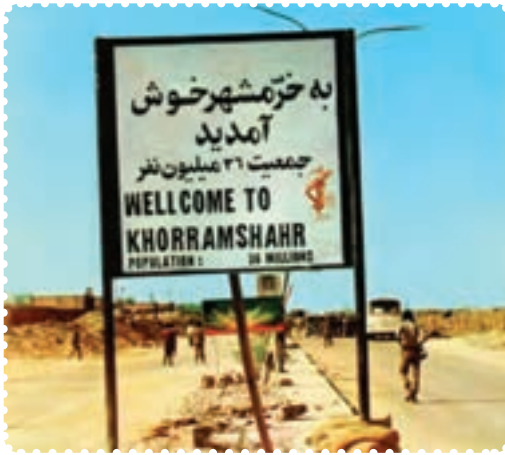
ورودی شهر خرمشهر در زمان جنگ تحمیلی

کمک به دفاع ملی دریغ نورزیدند. پس از چند هفته، دشمن متجاوز دریافت که خیال تصرف ایران، خام