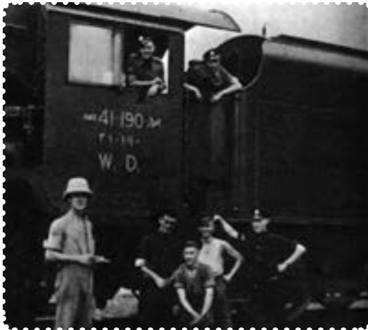
اشغالگران از راه آهن ایران برای مقاصد نظامی خود استفاده می کردند.

سرانجام در سوم شهریور ماه ۱۳۲۰/۲۵ اوت ۱۹۴۱ سفیران انگلیس و شوروی، طی