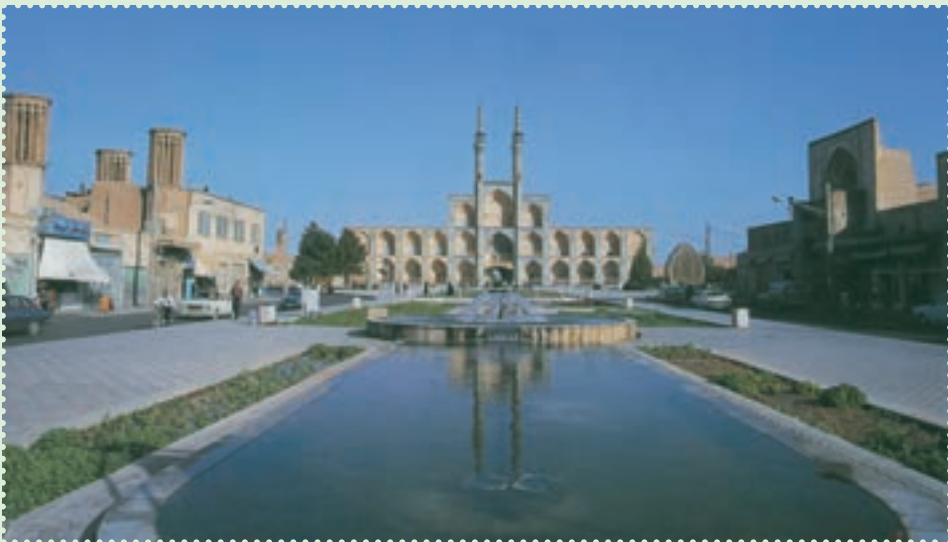
میدان تاریخی امیر چخماق در مرکز شهر یزد

با آنکه مغولان در آغاز ویرانی های بسیاری به همراه آوردند، ولی بر اثر آشنایی با فرهنگ ایران و اسلام، از طریق آنان فرهنگ، هنر و تمدن ایران و اسلام رواج یافت. پس از پایان حکومت ایلخانان، حکومت های ملوک الطوائفی و محلی متعددی چون تیموریان، آل جلائر، آل مظفر، سرداران و آل کرت، اتابکان، قراقویونلوها و آق قویونلوها طی قرن های هشتم و نهم قمری بر ایران حکومت کردند، اما هیچ کدام نتوانستند یکپارچگی ایران را حفظ کنند. سرانجام در سال ۹۰۷ق، حکومت صفوی توانست پس از