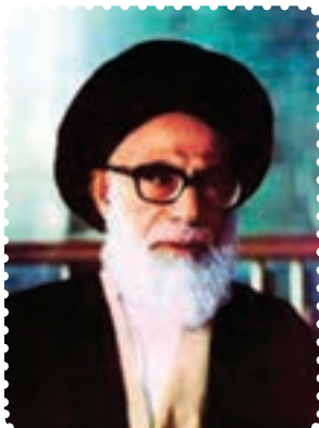
شهید آیت الله دستغیب

خواست تا به افسران فراری خارج از کشور بیوندند. اما این قتل های ناجوانمردانه، مردم را در عزم خویش استوارتر می ساخت. ترورهای پی در پی منافقین، تنها شخصیت های بلندپایه کشور را دربر نمی گرفت، آنها فقط در عرض یک ماه، ۳۷۰ نفر زن، مرد و حتی کودک را آماج حملات خود قرار دادند. برای ایجاد رعب و وحشت، بسیاری از ترورها مقابل چشمان سایر اعضای خانواده انجام می شد. تروریست ها حتی در مساجد و کانون های دینی و مصلاهای نماز جمعه، به انفجار بمب و ترور ائمه جمعه و جماعات اقدام می کردند. شهدای محراب، آیت الله سید عبدالحسین دستغیب در شیراز، آیت الله مدنی در تبریز، آیت الله صدوقی در یزد، آیت الله اشرفی اصفهانی در کرمانشاه و حجت الاسلام هاشمی نژاد، دانشمند و روحانی مؤثر مشهد، از این جمله بودند. ترور این دانشمندان و حتی عالمانی از روحانیان اهل سنت، نشانگر این بود که دشمنان انقلاب بیش از هر چیز، از اندیشه متفکران اسلامی بیمناک اند.