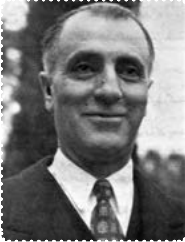
فضل الله زاهدی