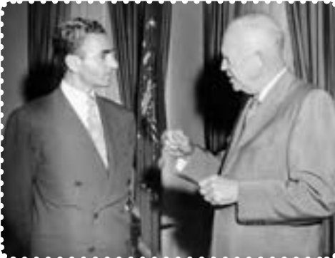
شاه در ملاقات با آیزنهاور رئیس‌جمهور آمریکا

آمریکا که از کمک به دولت دکتر مصدق اجتناب می‌کرد، پس از پیروزی کودتاچیان کمک‌های زیادی در زمینه‌های نظامی و اقتصادی به دولت کودتا کرد. ۱ باروی کار آمدن دولت نظامی زاهدی ۲ ، فضای تیره‌ای در جامعه ایران حکم فرما شد، فرمانداری نظامی تهران به سرتیپ تیمور بختیار سپرده شد. بختیار که افسری بی‌رحم و خونریز بود، برای استقرار و تثبیت حکومت کودتا، سرکوب نیروهای ضدکودتا