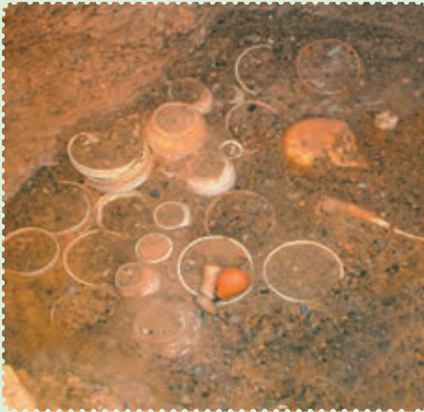
آثار یافت‌شده در شهر سوخته

پس از مدتی، زردشت که پیامبر ایران باستان است در میان ایرانیان ظهور کرد. او مردم را به پیروی از خدای یگانه که اهورامزدا نام داشت، دعوت کرد و مروج اندیشه، گفتار و کردار نیک بود. اعتقاد به سرای آخرت و جهان پس از مرگ، عقیده به آخرالزمان و ظهور یک منجی که حکومتی با عدل و داد و به‌دوراز ناپاکی و ستم برپا خواهد کرد، از بنیان‌های استوار و اعتقادی ایرانیان بوده است که آن‌ها را از سایر ملل دوران باستان متمایز می‌ساخت. ۲