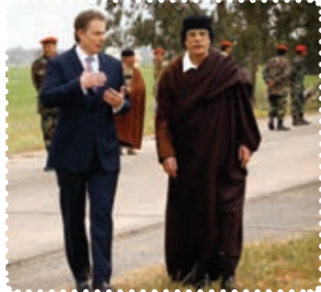
سرهنک قذافی دیکتاتور پیشین لیبی در کنار نخست وزیر انگلستان

کرد. سرانجام پس از ماه‌ها درگیری نظامی با سقوط طرابلس، حکومت قذافی سرنگون و خود او کشته شد. نکته جالب در مورد قذافی این است که وضعیت او بیش از هر دیکتاتوری به صدام شبیه بود. ت) بیداری اسلامی در یمن: جمهوری یمن در جنوب شبه جزیره عربستان واقع است و دارای نژادهای عرب (۸۶ درصد)، ترک، هندی، ایرانی و سومالیایی است. بیش از ۵۰ درصد یمنی‌ها شیعی مذهب‌اند که غالباً در منطقه صعده و شمال یمن ساکن‌اند. البته عمده شیعیان یمن زیدی‌اند که بعد از امام سجاد(ع)، زید بن علی(ع) را امام می‌دانند. مردم یمن در پی انقلاب‌های گوناگون در کشورهای اسلامی، اعتراضات و تظاهرات گسترده‌ای را در شهرهای مختلف علیه رژیم دیکتاتوری علی عبدالله