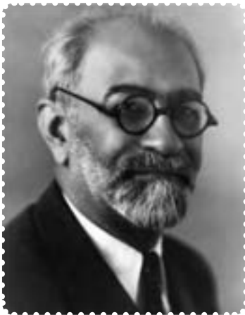
محمد علی فروغی

با انتقال سلطنت به سلسله پهلوی، محمدعلی فروغی (ذکاءالملک ۱ ) به عنوان اولین نخست‌وزیر دوران سلطنت رضاشاه منصوب شد. نخستین اقدام او، برپایی آیین تاج‌گذاری و نشستن رضاشاه بر تخت قدرت بود.