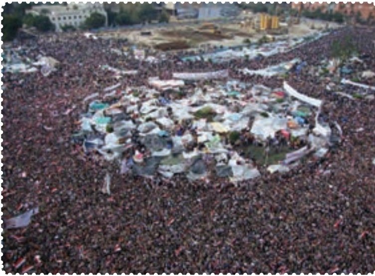
قیام مردم مصر در میدان التحریر (آزادی)

بیداری اسلامی در مصر ریشه‌دار بود و به همین دلیل شعله‌های انقلاب مردم مصر با یک تظاهرات زبانه کشید و به‌سرعت به مناطق دیگر هم سرایت کرد. امواج سهمگین انقلاب مردم حسنی مبارک را مجبور به تسلیم و شکست کرد.