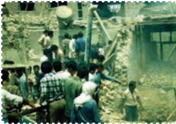
دزفول در پی یکی از حملات موشکی

در طول مدت جنگ شهرها، ارتش عراق موشک‌های دوربرد بسیاری به شهرهای ایران پرتاب کرد. ۱ به علاوه، استفاده از گازهای شیمیایی در جبهه‌های جنگ را در پیش گرفت. در چنین شرایطی، آمریکا رسماً به کمک نیروهای صدام آمد. اعزام ناوگان جنگی به خلیج فارس و هدف قرار دادن هواپیمای مسافربری ایران در تیرماه ۱۳۶۷، از جمله اقدامات ناجوانمردانهٔ آمریکایی‌ها بود.