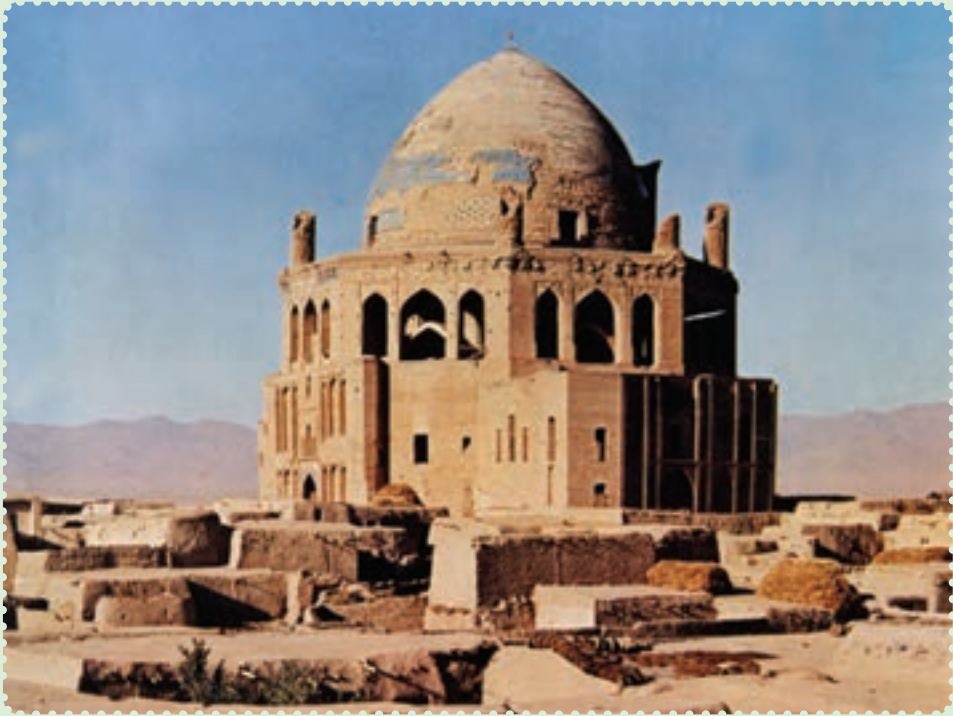
مقبره الجایتو، سلطانیه

چنگیزخان انجامید. این حادثه بهانه‌ای برای حمله به ایران بود. ۱ لشکرکشی مغولان یکی از بزرگ‌ترین راهپیمایی‌های نظامی تاریخ به‌شمار می‌رود. حدود ۲۵۰ هزار نفر از قبایل مغول، در سرمای سخت از سرزمین مغولستان در شمال چین، به فرماندهی تموچین (چنگیزخان) به سوی ایران سرازیر شدند. ۲ هدف نخستین آنها شهر اُترار بود، اما پس از قتل عام اهالی این شهر و دستگیری عاملان قتل بازرگانان، به سوی شهر بخارا و سایر ایالت‌های ایران پیشروی کردند. ۳ حمله مغول همچون طوفانی سهمگین، نه تنها طومار حکومت خوارزمشاهی را در هم پیچید، بلکه بیشتر شهرهای ایران را ویران و مظاهر تمدن باشکوه دوران اسلامی را نابود کرد. دامنه این تندباد، علاوه بر ایران، بخش‌های زیادی از جهان اسلام را نیز درنوردید. ۴