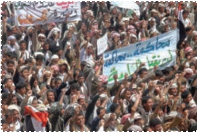
قیام مردم مسلمان یمن

کرد. سرانجام پس از ماه‌ها درگیری نظامی با سقوط طرابلس، حکومت قذافی سرنگون و خود او کشته شد. نکته جالب در مورد قذافی این است که وضعیت او بیش از هر دیکتاتوری به صدام شبیه بود. ت) بیداری اسلامی در یمن: جمهوری یمن در جنوب شبه جزیره عربستان واقع است و دارای نژادهای عرب (۸۶ درصد)، ترک، هندی، ایرانی و سومالیایی است. بیش از ۵۰ درصد یمنی‌ها شیعی مذهب‌اند که غالباً در منطقه صعده و شمال یمن ساکن‌اند. البته عمده شیعیان یمن زیدی‌اند که بعد از امام سجاد(ع)، زید بن علی(ع) را امام می‌دانند. مردم یمن در پی انقلاب‌های گوناگون در کشورهای اسلامی، اعتراضات و تظاهرات گسترده‌ای را در شهرهای مختلف علیه رژیم دیکتاتوری علی عبدالله